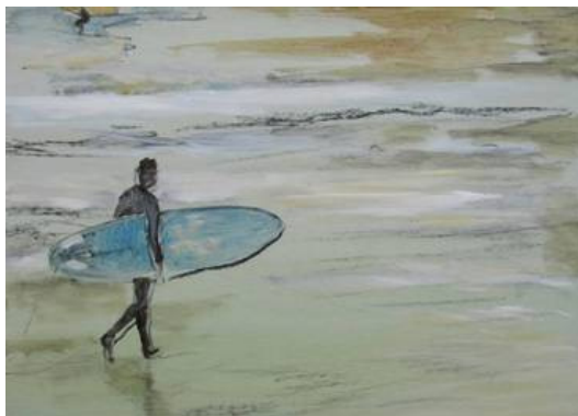
Marie Carolin Knoth Brandung 2014 Acryl, Kohle, Tusche auf Holz 29,3 x 40,5 cm

geschlossen: Faschingsmontag 03.02.2014 und Faschingsdienstag 04.02.2014