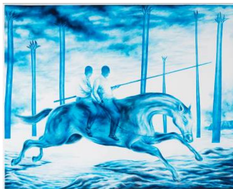
Sebastian Burger Ritt 2014 Öl auf Papier 110 x 140 cm